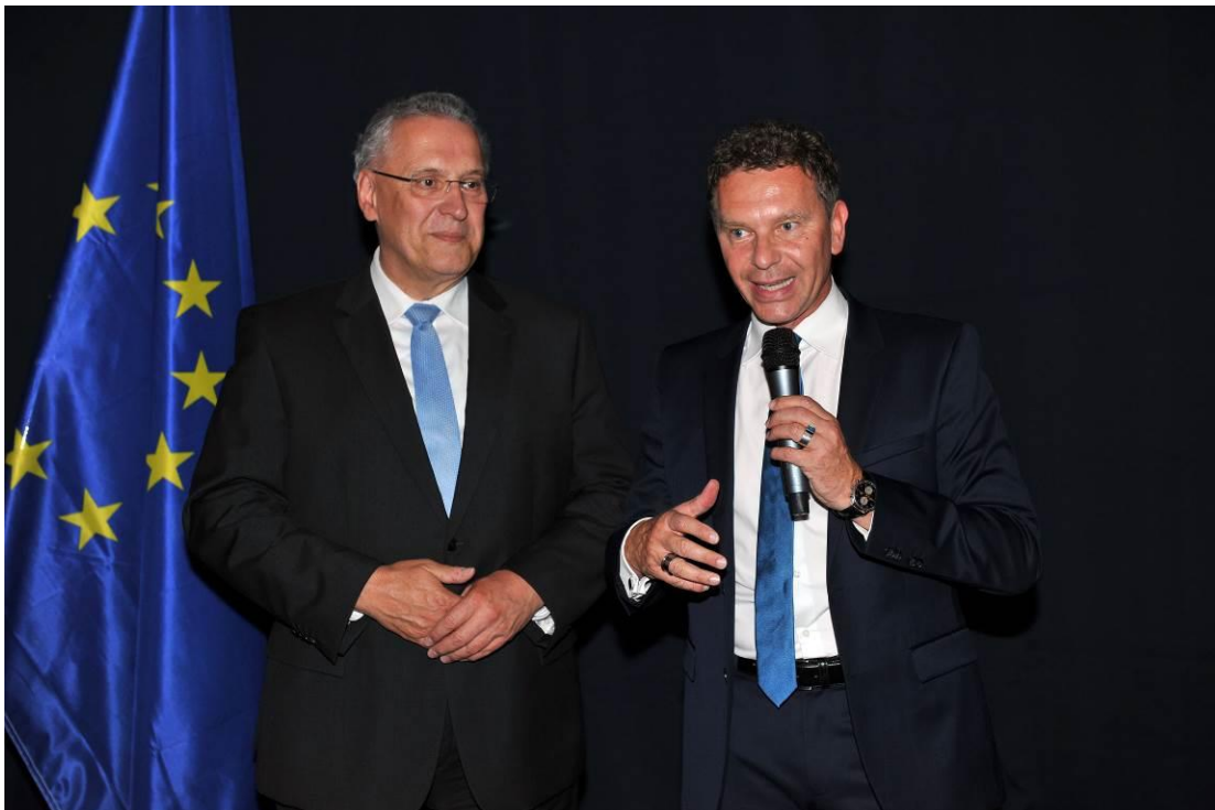
Der Bayerische Staatsminister Joachim Hermann und Sportmoderator Roman Roell während des Festakts zur Verleihung der Sportplakette des Bundespräsidenten an 27 bayerische Vereine, darunter auch der Ski-Club Kaufbeuren.

Skiclub Kaufbeuren e.V. Am Kesselberg 6, 87600 Kaufbeuren Tel. 08341/12591, kontakt@skiclub-kaufbeuren.de www.Skiclub-Kaufbeuren.de