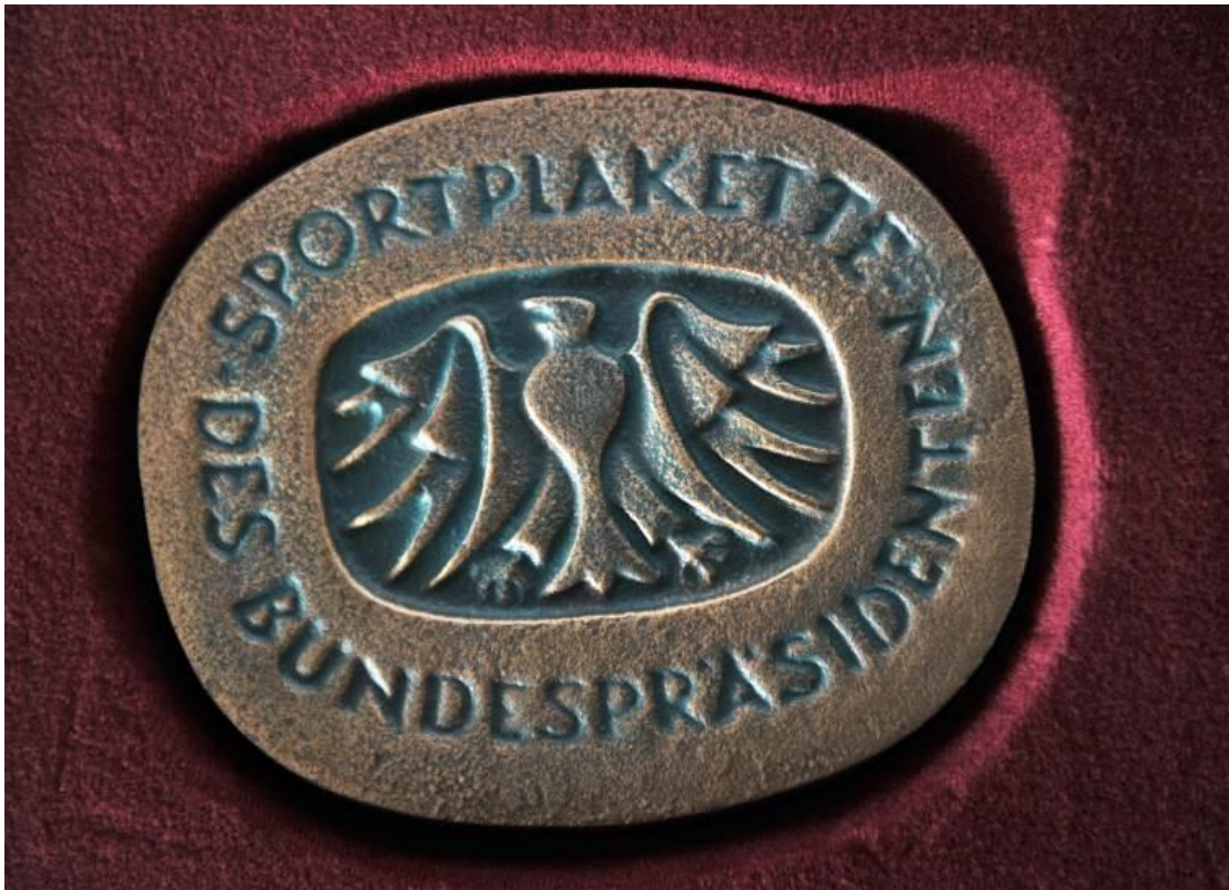
Die Sportplakette des Bundespräsidenten zum über 100-jährigen Bestehen des Ski-Club Kaufbeuren.